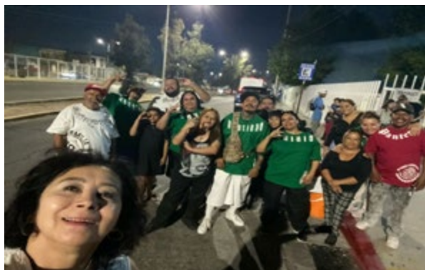
Modelo para la Intervención en la Práctica Comunitaria e Institucional (MIPCI)

Nota: Fotografía tomada el 18 de octubre de 2024.