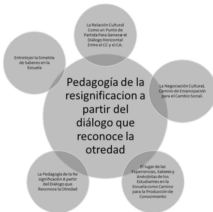
Figura 1. Categorías Emergentes: pedagogía de la resignificación a partir del diálogo que reconoce la otredad.

Para construir un discurso que potencie el diálogo, se necesitan actores diversos aparecen quien lo elabora, lo manifiesta y quien lo escucha, es así como el emisor y el receptor parten de un acercamiento mínimo, la palabra se vuelve texto de quien escucha y quien es escuchado, y este texto emana de un contexto donde se viven las experiencias. Una maestra considera que no hay resignificación del conocimiento ancestral en la escuela o por lo menos no se toma como un proyecto importante.